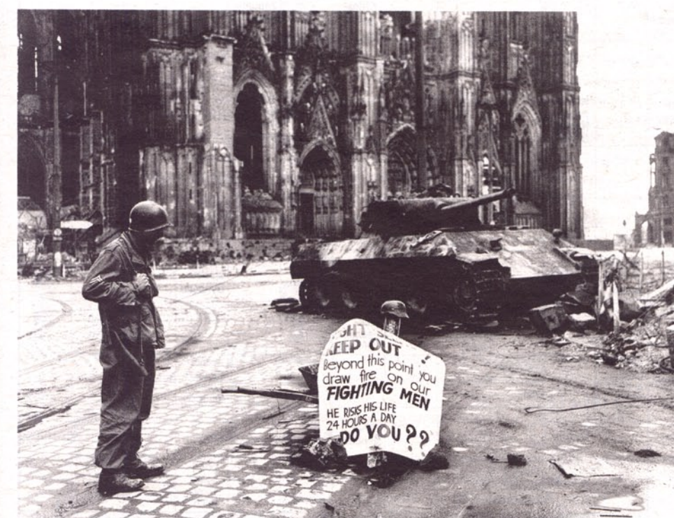
Ein US-Soldat steht am Kölner Dom vor dem wenige Wochen vorher beim Gefecht am 6. März 1945 zerstörten deutschen Panzer vom Typ „Panther“.