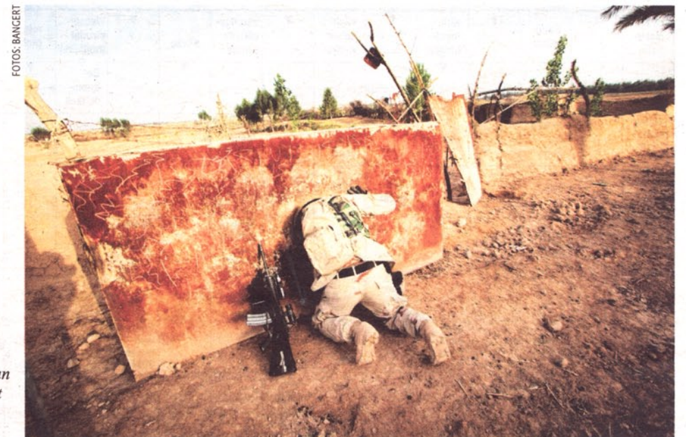
Ein amerikanischer Soldat im Irak sucht nach Waffen in einem stillgelegten Wassertank.

Natürlich. Gerade bei älterem Material. Es ist faszinierend. Teilweise sind die Bilder auch ästhetisch. Natürlich ist es interessant, diese Bilder anzusehen. Aber das ist ja auch nichts Schlimmes. Vielleicht ist das sogar ganz gut so,