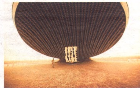
Soldatendenkmal in Bagdad

Ist es auch wichtig, sich alte Fotos vom Leid anzuschauen? Es macht einen Unterschied, ob die Bilder aus